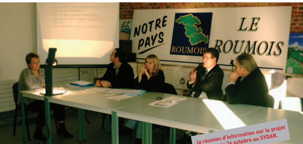
la réunion d'information sur le projet RESAIDA le 26 octobre au SYDAR.