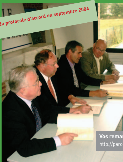
signature du protocole d'accord en septembre 2004

Vos remarques sur ce projet : http://parc-economique-roumois@wanadoo.fr