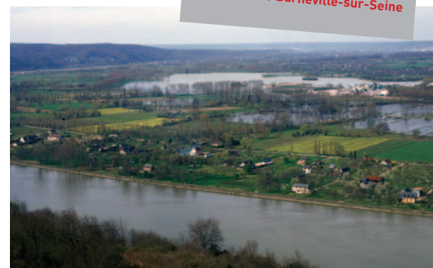
panorama de Barneville-sur-Seine

Le Contrat de Pays prévoyait la construction d'un gîte de groupe sur le site du Panorama de Barneville sur Seine. L'ensemble des financements a été obtenu début septembre (Europe, Conseil général de l'Eure, Région Haute-Normandie, Etat). Les travaux débutent dès janvier 2005.