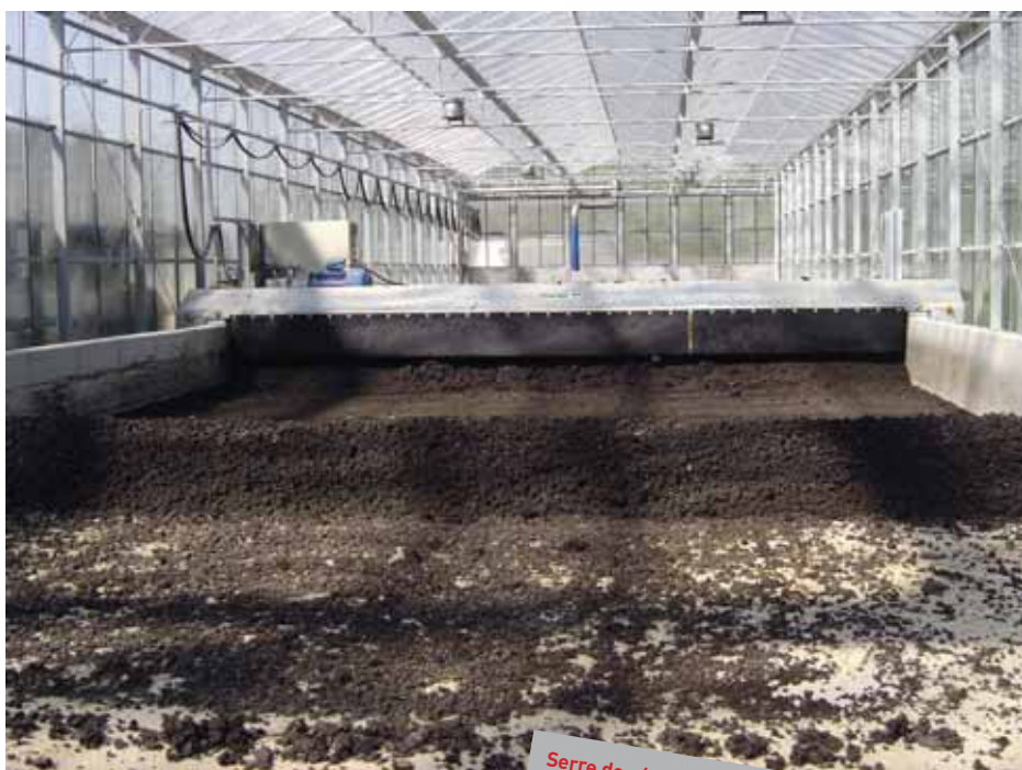
Serre de séchage des boues.

Rendez-vous sur Internet : www.ecologie.gouv.fr