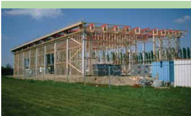
Avancement du chantier au mois de mai 2005.

Et demain ? Le Contrat de Pays s'achève en décembre 2006. Déjà, il est temps de se projeter dans l'avenir et de définir les orientations qui permettront au Pays du Roumois de s'affirmer comme un territoire attractif où il fait bon vivre.