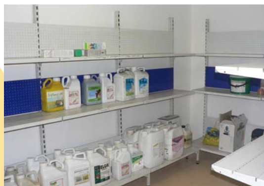
Local phyto aux normes

Depuis le début du Contrat Territorial du Roumois en 2004, 38 exploitations ont bénéficiés d'aides pour la réalisation de leurs locaux de stockage de produits phytosanitaires. Que ce soit son aménagement dans un bâtiment existant ou l'achat d'un container « clé en main », l'AGR'EAU apporte une aide technique et financière : 40 % du coût HT avec un plafond de 1 200 € d'aide (financement SERSAEP)