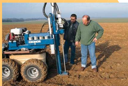
Prélèvement d'un reliquat au quad

Le reliquat d'azote en sortie d'hiver permet de connaître précisément la quantité d'azote présente dans le sol. Il sert au calcul de la dose totale à apporter grâce à la méthode du bilan : Besoin de la plante – Fournitures du sol.